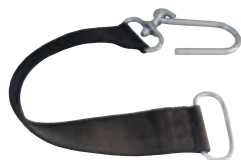
Sangle de support tuyau P 603