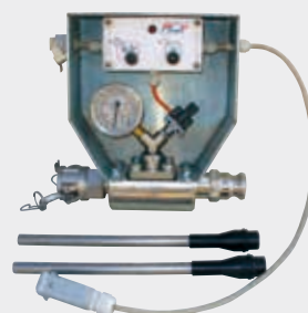
Kit "Spécial Injection" P 731