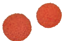
Balles de nettoyage 2 balles de nettoyage P 602